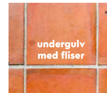
undergulv med fliser

Undergulvets fuktighet må være mindre enn 75 % relativ luftfuktighet ved minst 20 °C. Det må være maks 2 % CM for sement og 0,5 % for anhydritt. Når det er varme i undergulvet, skal fuktigheten være mindre enn 1,8 % CM for sement og 0,3 % for anhydritt. Mål alltid fuktigheten og ta vare på målingene.