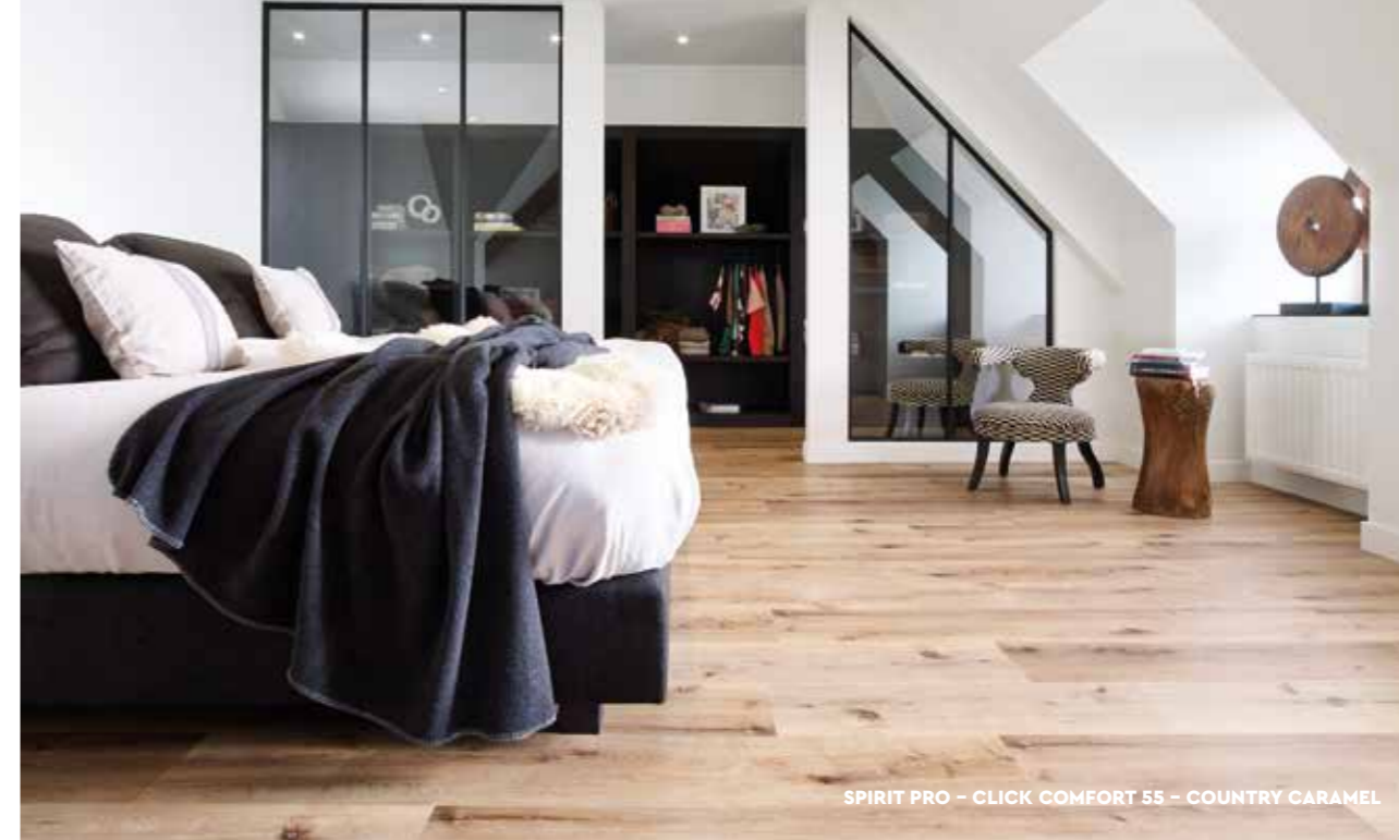
SPIRIT PRO – CLICK COMFORT 55 – COUNTRY CARAMEL