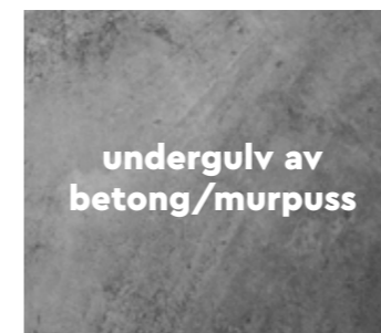
undergulv av betong/murpuss