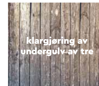
klargjøring av undergulv av tre

Skjøtene i det nye gulvet må ikke være på samme sted som fugene i flisene under. Det er ikke nødvendig å fylle fugene på et undergulv med keramiske fliser så lenge fugene ikke er mer enn 5 mm brede. Merk at enkelte keramiske fliser har opphøyde kanter/hjørner selv om høyden ellers er lik. Disse opphøyningene kan vise gjennom gulvet i fremtiden.